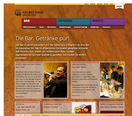
Webseiten-Relaunch: Startseite der Rubrik „Bar“

Abdruck honorarfrei. Beleg erbeten.